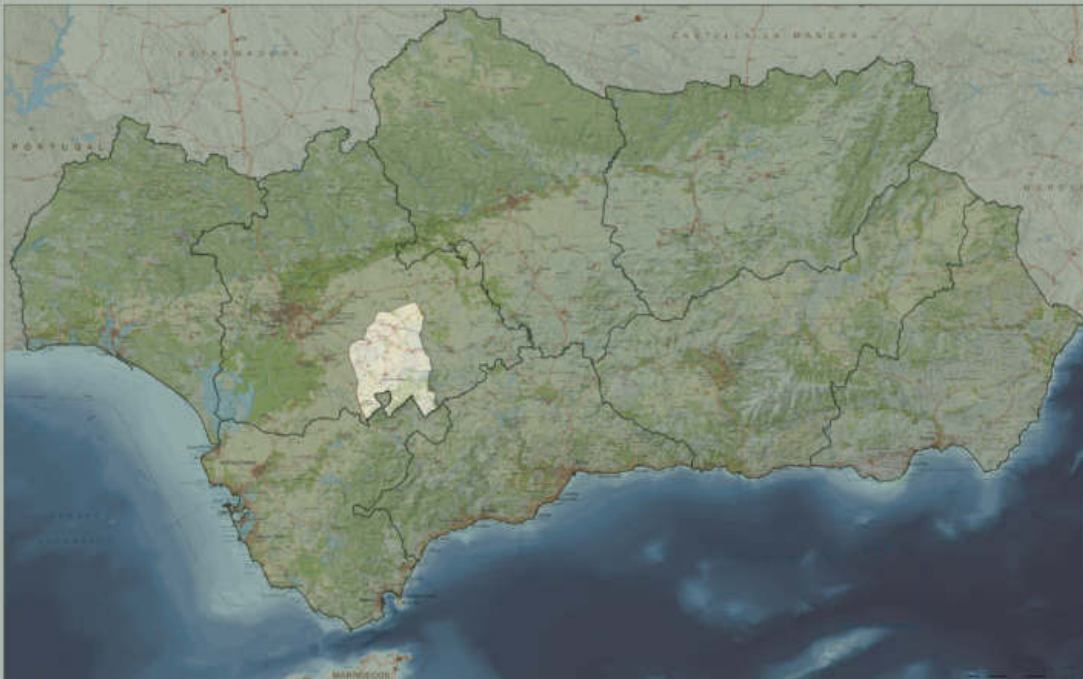
Mapa 1. Localización de la ZRL

Los principales núcleos secundarios del área son los siguientes: Base Aérea de Morón en Arahál, Caleras de la Sierra, Guadaíra y la Ramira en Morón de la Frontera.