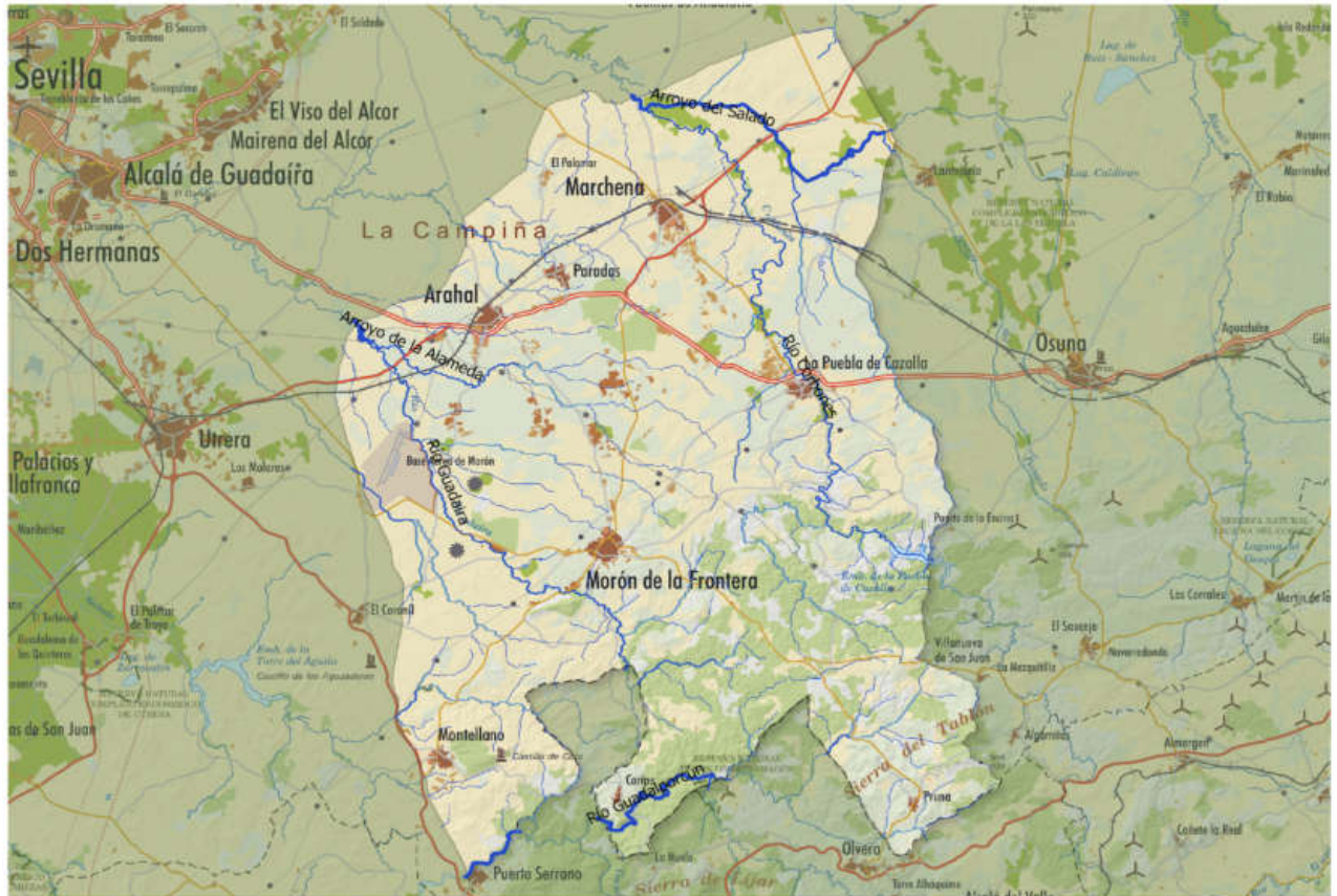
Mapa 4. Hidrografía. Ríos

En relación a los espacios naturales protegidos, la Serranía Suroeste Sevillana cuenta con un total de 53,44 hectáreas, de las cuales 40,05 hectáreas son reservas naturales y 13,39 hectáreas son parques periurbanos.