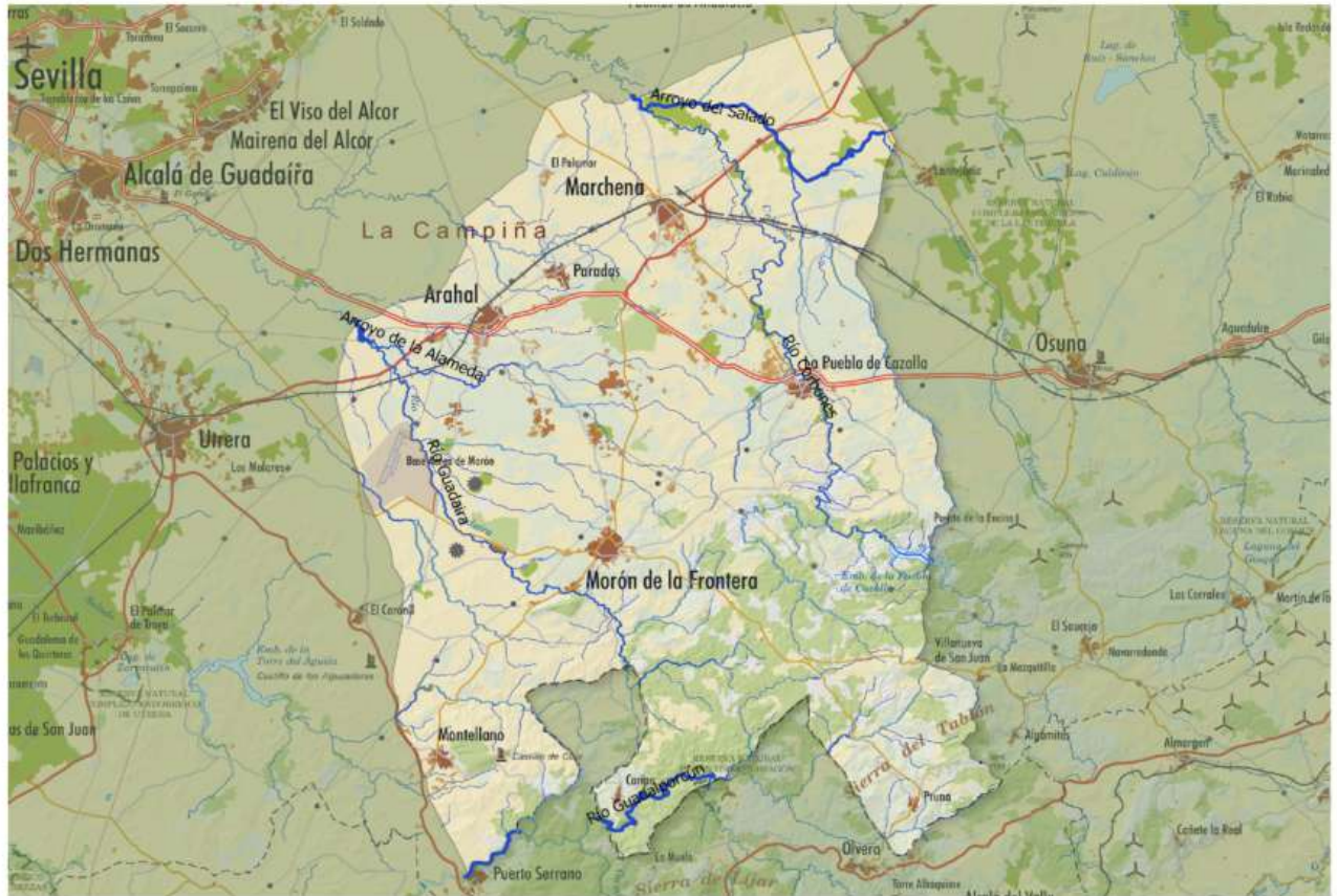
Mapa 4. Hidrografía. Ríos

En relación a los espacios naturales protegidos, la Serranía Suroeste Sevillana cuenta con un total de 53,44 hectáreas, de las cuales 40,05 hectáreas son reservas naturales y 13,39 hectáreas son parques periurbanos.