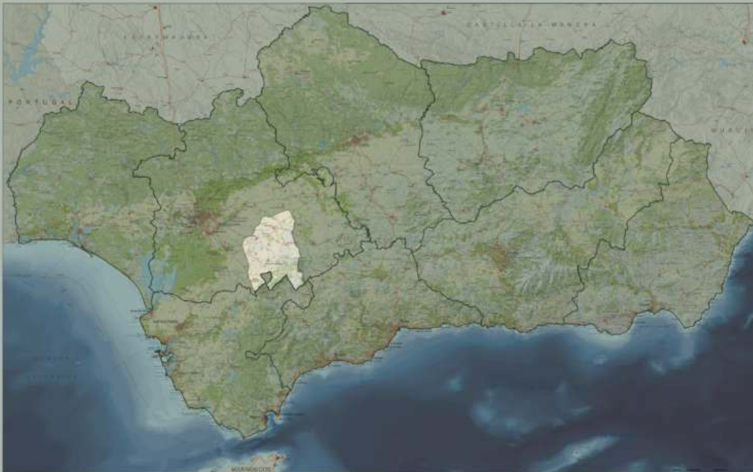
Mapa 1. Localización de la ZRL

Los principales núcleos secundarios del área son los siguientes: Base Aérea de Morón en Arahál, Caleras de la Sierra, Guadaíra y la Ramira en Morón de la Frontera.